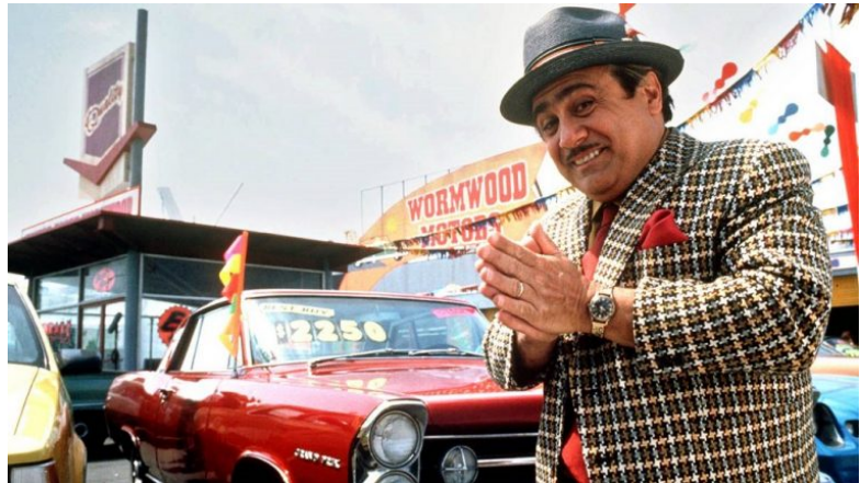
Foto: Harry Wormwood - Matilda

Visitar un lote de autos usados o un concesionario puede ser una experiencia desafiante. Entre el inventario de vehículos y el personal de ventas es fácil sentirse abrumado. Esta sección lo ayudará a navegar el proceso de ventas, prepararse para responder a los vendedores y estar listo para el proceso de compra.